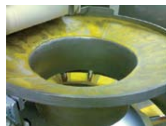
Imbuto di raccolta pasta secca su bilancia pesatrice.