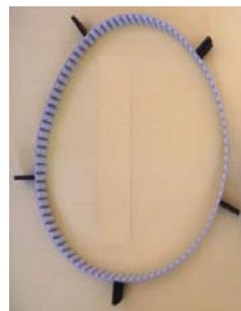
Cinghia dentata con tasselli in poliuretano rintracciabile con metaldetector.