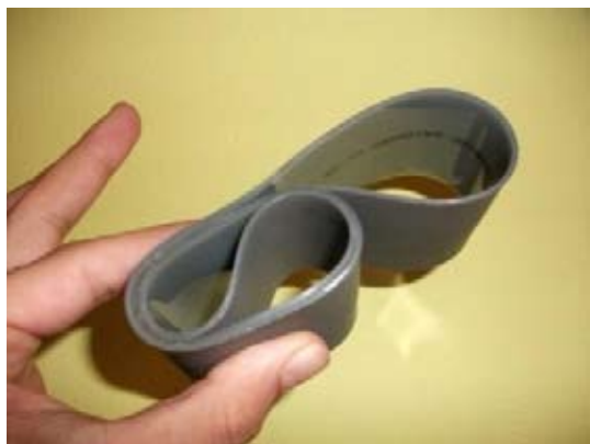
Esempio di massima flessibilità del nastro 2L-EI7-MD80-TL.

Le durezza standard sono la 85 Shore A e la 92 Shore A che conferiscono al semilavorato un coefficiente di aderenza e flessibilità differente a seconda della necessità.