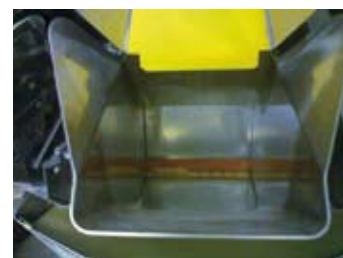
Rivestimento di dosatore pasta secca.