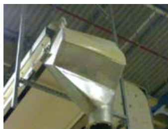
Bandinella di contenimento alimento in caduta su tramoggia.